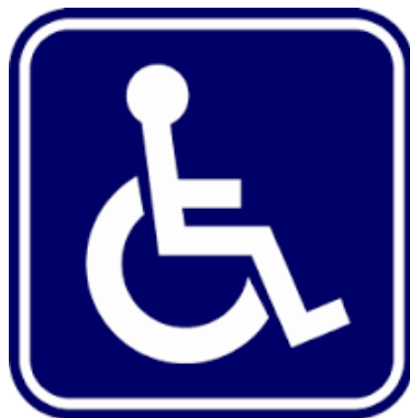
สัญลักษณ์ผู้พิการ